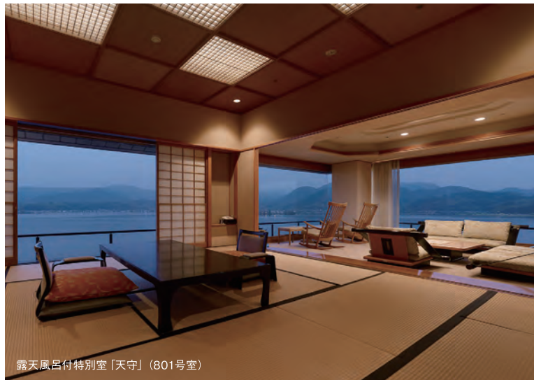
露天風呂付特別室「天守」(801号室)

露天風呂付客室棟「湯の栖」は、 ご夫婦やカップル、気心の知れた グループやご家族など、 幅広くご利用いただけます。 全室、100%源泉掛け流しの 天然温泉を引き入れ、 お部屋により様々なタイプの お風呂をお楽しみいただけます。