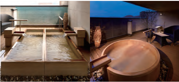
露天風呂付客室「桐壺」(324号室)