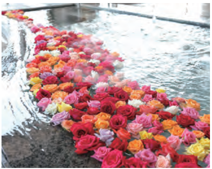
バラ風呂 (平日:月~金曜日 13:00~23:00) / 夕陽にて

【効能】 神経痛・筋肉痛・関節痛・五十肩・運動麻痺・関節のこわばり・うちみ・くじき・慢性消化器病・痔疾・冷え性・病後回復期・疲労回復・健康増進・切り傷・やけど・慢性皮膚病・虚弱児童・慢性婦人病・動脈硬化 など