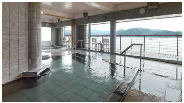
湖上露天風呂「夕陽」

東郷湖の180度のパノラマを望む日本で唯一の湖上露天風呂。あたかも自分が湖につかっているかのような開放感と日頃の疲れを癒します。