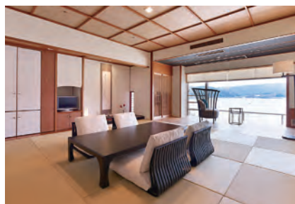
湖上閣 エグゼクティブルーム・サンライズ

湖上閣の湖上温泉側の角部屋は 特別室と同じロケーションの180度ガラス張りで、 朝陽や移りゆく東郷湖の景色が楽しめます。 湖上閣は当館の東側に位置しておりますので、 すべての客室より朝陽をご覧いただけます。