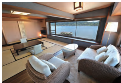
対水閣 モダンルーム

12帖の和室をはじめ、ツインベッドを備えた 和洋室、和洋折衷のモダンルームなどで おくつろぎいただけます。 また、すべてのお部屋から東郷湖を望むことができ、 日常の喧噪をしばし忘れさせてくれます。