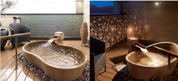
露天風呂付客室「篝火」(326号室)